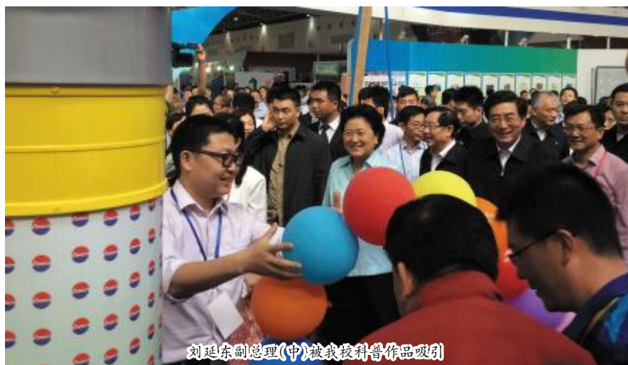
刘延东副总理(中)被我校科普作品吸引

5月17日,2014年全国科技活动周大型科普博览在北京全国农业展览馆开幕。我校科学技术教育团队研发的3件作品入选展出,受到刘延东副总理关注。