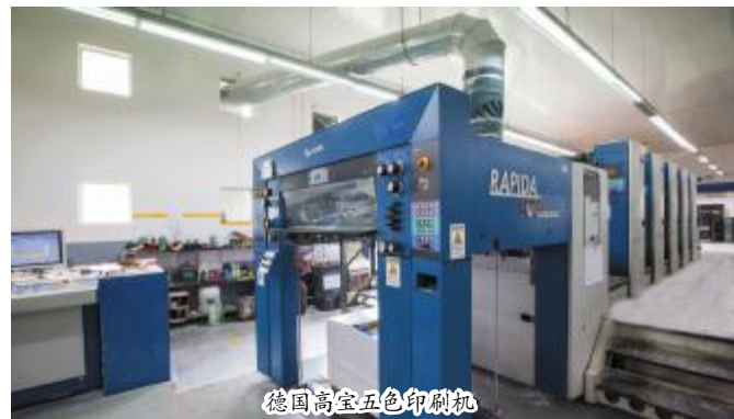
德国高宝五色印刷机