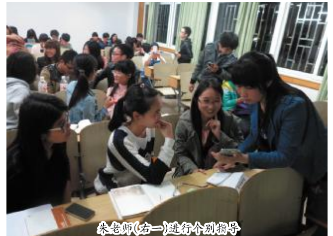
朱老师(右一)进行个别指导