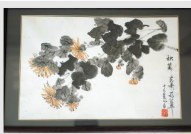
秋菊(水墨画) 冯志奇作