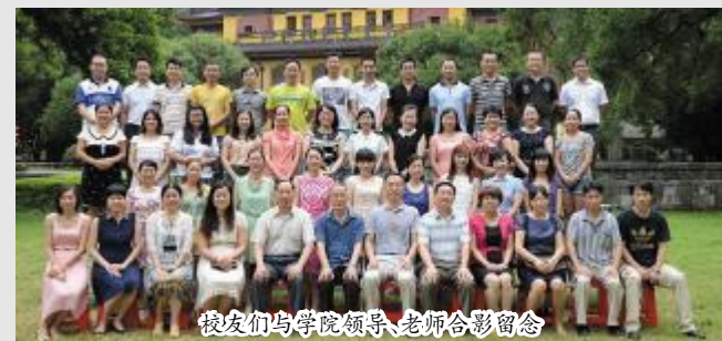
校友们与学院领导、老师合影留念

6月28日,文旅学院2000级校友毕业10周年欢聚母校,举行座谈会,追忆大学求学时光,参观王城校区。校长办公室、校友总会秘书处、文旅学院领导和老师代表出席了相关活动。(尹小晴)