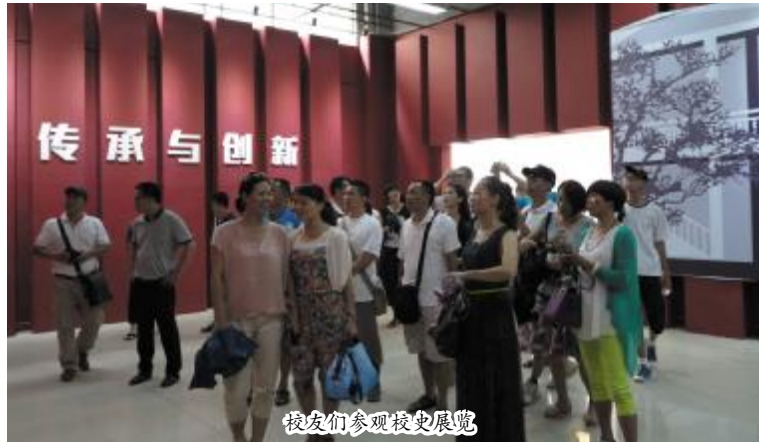
校友们参观校史展览

怀着对母校的向往和对老师同学的思念,8月5日,原体育系90级校友回母校开展毕业20周年的纪念活动。在活动期间,他们见到了许多久违的同学,感慨万分;看到了学校的巨大变化,激动不已。他们通过参观、座谈,激发了对母校、老师、同学的深厚感情。(尹小晴)