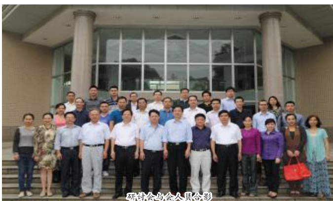
研讨会与会人员合影

研讨会还通过了成立“广西高校校友工作研究会”的决定,选举产生了广西大学为会长单位;我校等9所院校为副会长单位和理事单位。(黄河清)