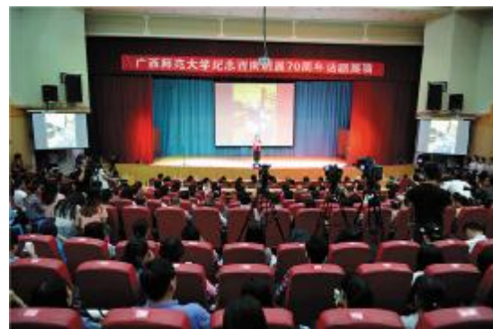
“新西南剧展”活动开幕式