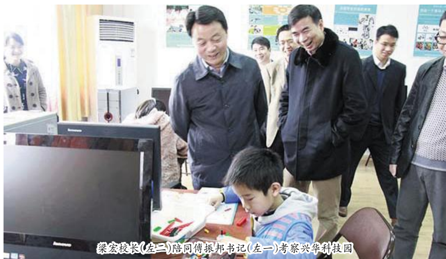
梁宏校长(左二)陪同傅振邦书记(左一)考察兴华科技园

3月23日,团中央书记处书记傅振邦来我校调研,主要内容是高校基层团组织建设和培育践行社会主义核心价值观的情况。他除召开座谈会外,还到我校兴华探究乐园、校团委广西“青马工程”基地、文旅学院进行考察。