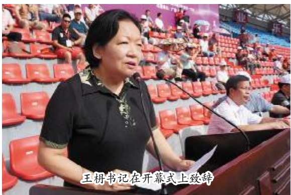
王柎书记在开幕式上致辞

7月14日至17日,第六届全国高等师范院校大学生田径运动会在我校雁山校区举行。来自全国68所院校的70支代表队共892名运动员参加了比赛。