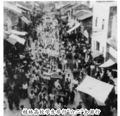
桂林高校学生举行“六二”大游行