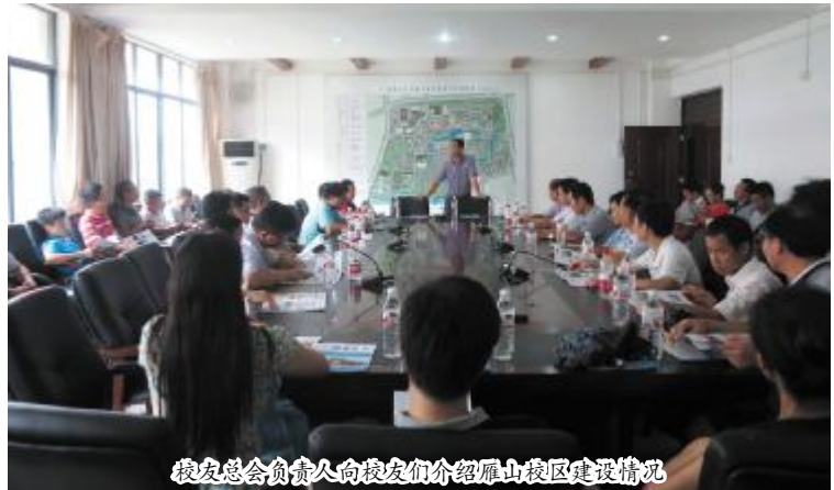
校友总会负责人向校友们介绍雁山校区建设情况

7月26日至27日,原数学系90级校友回母校开展以“师恩难忘,友谊长存”为主题的毕业20周年的纪念活动。在活动期间参观了雁山校区,听取了校友总会秘书处负责人关于雁山校区建设的介绍。(尹小晴)