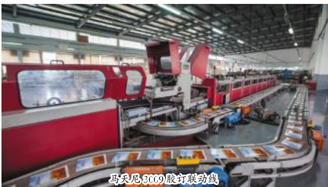
马天尼3009胶订联动线