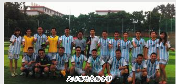
足球赛结束后合影

7月20日,我校驻邕校友学干联谊会在南宁正发富德球场举行足球比赛,20多名联谊会成员及校友总会副秘书长黎武参加了此项活动。(贵尚明)