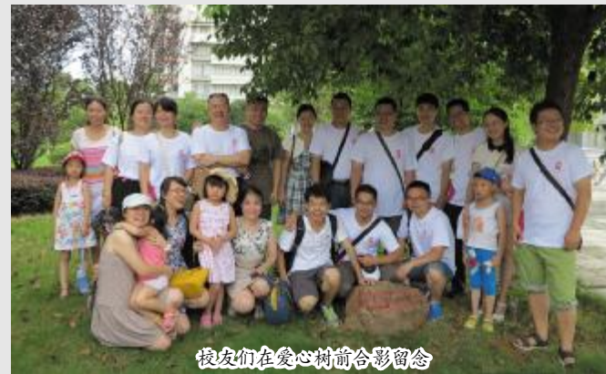
校友们在爱心树前合影留念

覃卫国副校长代表学校对校友们表示热烈欢迎,对校友们长期以来对学校的关心与支持表示衷心的感谢。校友总会秘书处负责人陪同参观了雁山校区,了解了学校的发展规划,捐种了爱心树。(尹小晴)