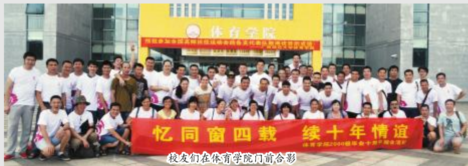
校友们在体育学院门前合影

7月11日至13日,体育学院2000级校友回母校举行“忆同窗四载,续十年情谊”的纪念活动。覃卫国副校长出席了相关活动。活动期间,校友们参观了王城校区、育才校区和雁山校区,捐种了爱心树。(苏政、尹小晴)