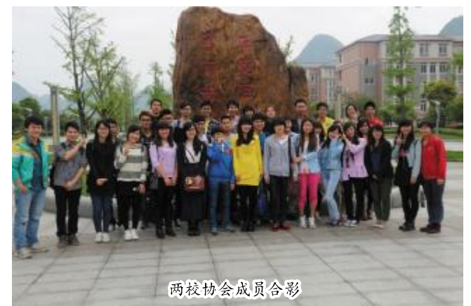
两校协会会员合影