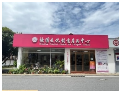
育才校区文创店地址： 立人大道中华传统文化 名人园斜对面