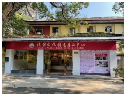
王城校区文创店地址： 独秀路邮电代办所旁