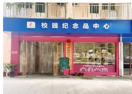
雁山校区文创店地址： 四期宿舍1号门面 (四期供餐点旁)