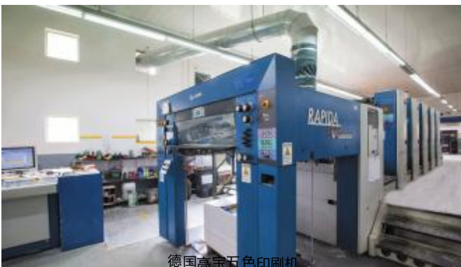
德国高宝五色印刷机