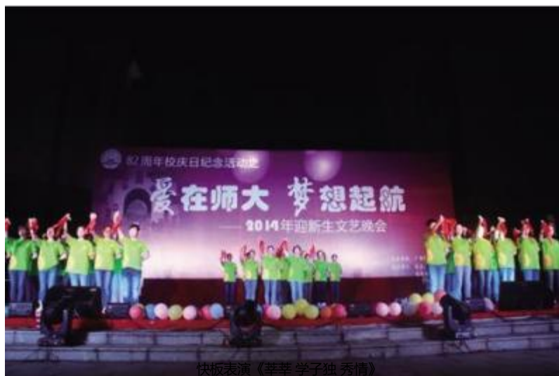
快板表演《莘莘学子独秀情》

2014年10月12日晚七点，我校82周年校庆日纪念活动之“爱在师大，梦想起航”文艺汇演暨2014年迎新文艺晚会在雁山校区孔子广场隆重开演。校党委书记王柁、副校长陈洪江及各职能部门、各学院主要负责人出席了本次晚会。