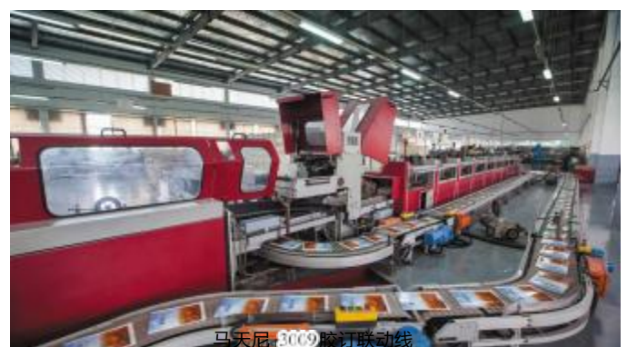
马天尼3009胶订联动线

加工于一体，形成了专业化的印刷体系，为广大客户提供优质、高效、低耗、诚信的服务，年产值为1.5亿元。