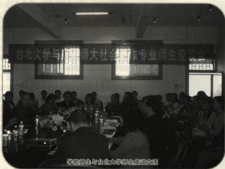
学院师生与台北大学师生座谈交流

室,下设4个分室,即团体工作室、社会调查与分析室、物证分析室、模拟法庭;建有法学图书资料室,藏书2万多册,专业学术刊物115种,包括《哈佛法律评论》、《美国比较法杂志》、《商法杂志》等期刊。