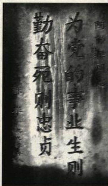
原中共广西省工委书记陈保桓烈士墓碑