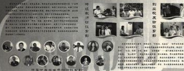
校友访谈活动成果展