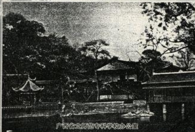
广西省立师范专科学校办公室

一、自由而热烈的学术讨论。学习时间表上,每天早上都安排一节“朝会”,让同学们进行学术讨论。讨论提纲由学校统一拟定,资料由同学们到图书馆寻索。讨论时自由发言,可以侃侃而谈,不受限制,各种不同的观点可以充分表述,不受干预,也可以辩论或互相批评。讨论到一定程度,由主持讨论的老师作结论,不同意者,仍可保留自己的意见。