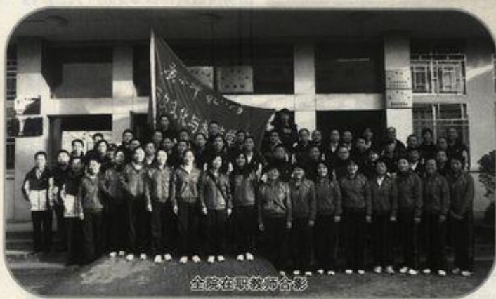
全院在职教师合影

历史文化与旅游学院是我校成立最早的院系之一,其前身为1932年广西省立师范专科学校的历史专修科。在学院发展的历史进程中,国内著名学者杨东莼、薛暮桥、杨荣国、黄现璠、陈伟芳、钟文典、万仲文、钱宗范等人均留下辛勤耕耘的足迹。