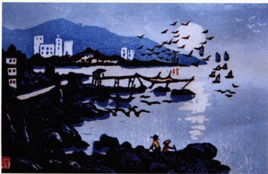
海上生明月(套色木刻) 16.5 × 25cm