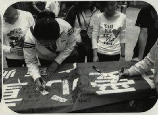
志愿者在爱心横幅上签名

在 5·12 汶川大地震一周年之际, 我校“小黑板计划”发起“与地震灾区孤残儿童共成长”行动, 组织志愿者赴汶川地震灾区献爱心。