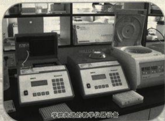
学院先进的教学仪器设备

目前,学院拥有 2 个系即生物科学系和生物技术系,1 个省级生物学实验教学示范中心,1 个省部共建教育部重点实验室即珍稀濒危动植物生态与环境保护实验室,1 个共建广西重点实验室即环境工程与保护评价实验室,1 个广西高校重点实验室即野生动植物生态学实验室,2 个校级研究所即珍稀濒危动植物研究所和应用生物研究所;设有植物生物学、动物生物学、分子生物学、应用生物学 4 个教研室和细胞工程、分子生物学 2 个科学研究室,以及生物科学、生物技术、生态学 3 个本科专业,在校本科生有 700 多人;拥有生态学、野生动植物保护与利用、动物学、生物化学与分子生物学、植物学等 5 个硕士学位授予点,均