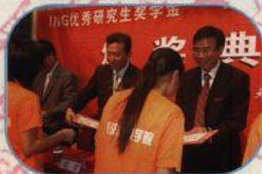
领导们为获奖学生颁奖

桂林市委书记、市人大常委会主任刘君,荷兰国际集团保险大中华区首席执行官张志明先生,荷兰国际集团保险中国首席代表杨丽君女士及我校校长梁宏出席颁奖仪式并为学生颁奖。