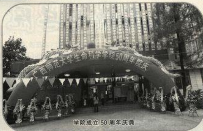
学院成立 50 周年庆典

生命科学学院改名为 2002 年,其前身是创建于 1959 年的生物学系。经过 50 年的建设,该院已成为一个以本科教育为主,师范与非师范专业并存,基础学科与应用学科并举,集教学、科研、开发和生产于一体的多层次、多学科综合办学实体,成为广西生命科学教学、科研和人才培养的重要基地。