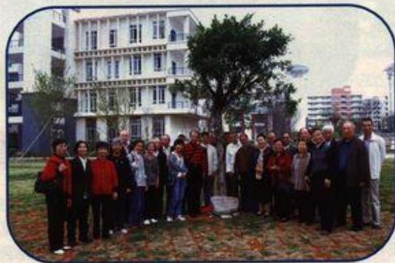
校友们在捐种的树旁合影

10月20日,我校原外语系58—63级俄语班校友欢聚母校,借庆祝中俄建交60周年“俄语年”的机会,回味大学生活,分享晚年幸福。在参观雁山校区时,他们为校友林捐种了爱心树。(陈国华)