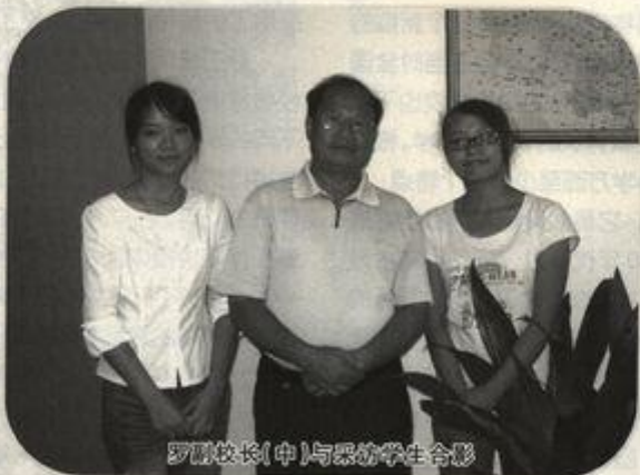
罗副校长(中)与采访学生合影

罗副校长虽然长期生活在群山环抱的革命老区，思想理念却比较前卫。他常说：“我们虽然身处革命老区，面对的又