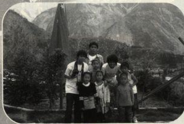
志愿者与灾区儿童在国旗下合影