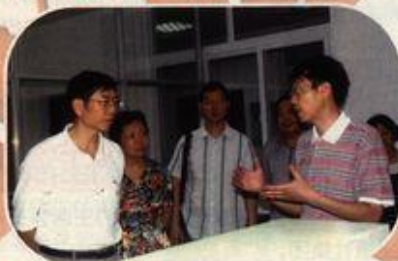
张先恩司长(左一)考察我校实验室

7月14日,国家科技部基础司司长张先恩一行在自治区科技厅副厅长蒋和生、桂林市副市长巫家世等领导陪同下,来我校药用资源化学与药物分子工程重点实验室调研。