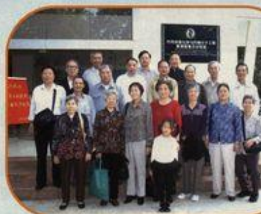
校友们与学院领导、老师在实验室前合影

他们参观王城校区、育才校区后，在化学化工学院会议室与母校领导、老师座谈，聆听学校概况和发展规划，仔细了解化学化工学院在教学、科研等方面的发展情况和近年来所取得的成绩，还亲临学院实验教学中心、药用资源化学与药物分子工程教育部重点实验室和师生进行交流。他们对母校几十年来的发展变化感慨万千，对化学实验室已拥有 3000 多万元大型仪器设备，能承担国家重大科研课题的现状表示非常欣慰。最后，他们还参观了雁山校区。（化学化工学院）