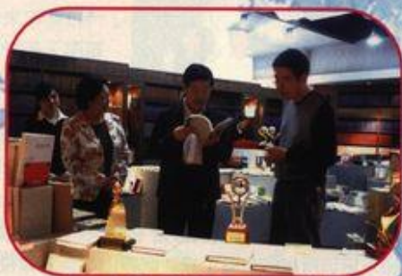
马铁山主席（右二）翻看出版社的图书

在视察时，马铁山主席向出版社集团详细了解了集团的组织架构及经营情况，对出版社频频获国家大奖大加赞扬，对其最近在全国书籍设计艺术展优秀作品评选活动中名列榜首赞赏有加。在图书陈列室，马主席如数家珍地点评了一些图书，让在场的同志深为感动和钦佩。马主席称赞我校出版社的学术人文图书编得很有品位，很有特色，希望能为读者奉献更多更好的精神食粮。随后他观看了出版社的介绍短片，听取了领导班子关于企业发展经验的汇报，并询问了出版社转企改制、成立集团后的发展规划和存在的困难。马主席表示：“能清醒认识到这些问题和挑战，就意味着你们会取得新的成功。祝广西师大出版社越办越好！”（段海风 赵亮）