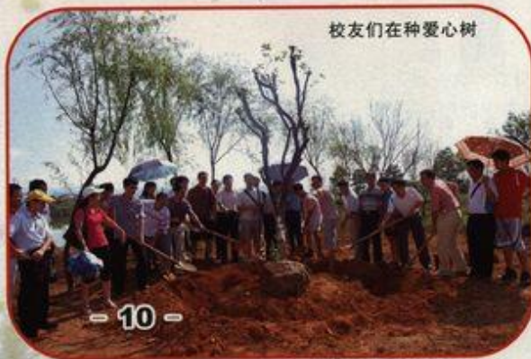
校友们在种爱心树

7月31日,我校原化学系85级校友回校举行毕业20周年纪念活动,并借参观雁山校区的机会捐种了爱心树。校友总会负责人代表学校参加了他们的活动,并接受梁宏校长的委托宣读了贺信。校友们回首往事,非常感谢母校和老师的培养,表示将一如既往地关心和支持母校,祝母校明天更加美好。(陈国华)