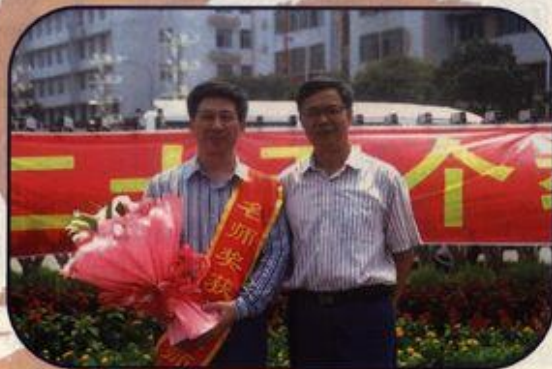
钟瑞添副校长迎接罗星凯教授(左)载誉归来

罗星凯教授长期从事物理学科教育和教师教育的研究与改革,主编的教材2003年获广西高校优秀教材一等奖,2006年获全国教育科学研究优秀成果三等奖,主持的课程2007年被教育部评为国家精品课程。他本人2001年被评为全国模范教师,2005年被评为全国先进工作者,2006年被评为广西高校教学名师。(赵亮)