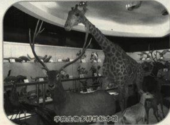
学院生物多样性标本馆

还建有一个动植物标本种类数量较多、展示环境良好的生物多样性标本馆,经常接待桂林市的青少年、教育部门的