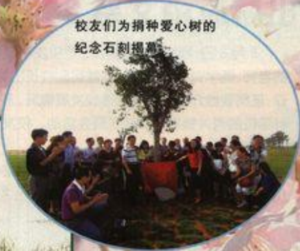
校友们为捐种爱心树的 纪念石刻揭幕