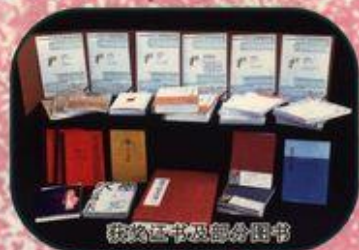
获奖证书及部分图书