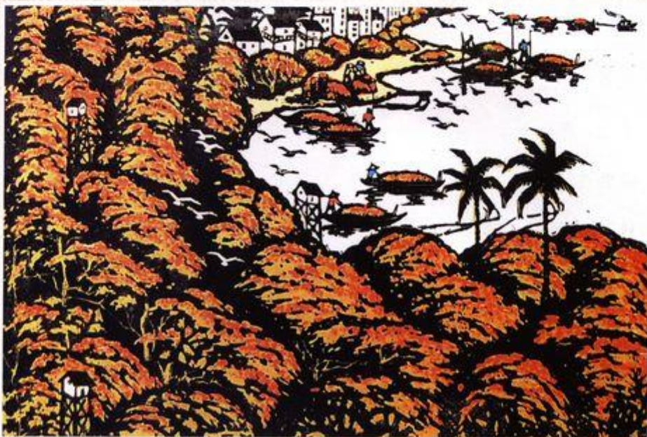
六月荔枝丹(套色木刻) 32 × 45cm

宋贤邦教授系我校原中文系 57 级校友，毕业后先留校后调外省工作。他曾任我校艺术教研室副主任、广东省珠海市教育学院中文系主任、泰山艺术研究院教授等职，是中国美术家协会会员、中国版画家协会会员。他学生时代就钟情于木刻艺术，并开始创作，曾有 100 多幅作品在省级以上报刊发表，多幅作品参加全国美术作品展览并被天津艺术博物馆收藏。现选登他的两幅套色木刻，以飨读者。