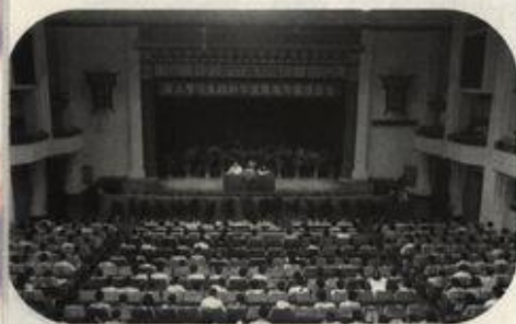
桂林市委书记刘君在我校作报告

6月30日,桂林市委书记、市人大常委会主任刘君应邀来我校作报告。他在讲到关于我校王城校区的保护、开发和利用时,讲了六句箴言:第一,长期以来,广西师大的师生为保护王城作出了巨大贡献,市委、市政府和广大市民不会忘记;第二,广西师大的发展需要走出王城,寻找更大的空间;第三,王城既然是文物,就应该恢复其文物的面貌,更好地呈现其历史文化价值;第四,王城改造好后,王城的管理、经营仍由广西师大负责,王城所得的任何收益,桂林市委、市政府一分钱不要;第五,王城现有的资源还要进一步整合、开发,要把旅游、文化、历史这些元素好好利用起来,大有文章可做;第六,桂林市委、市政府会一如既往地支持广西师大的建设和发展。(赵亮 何龙平)