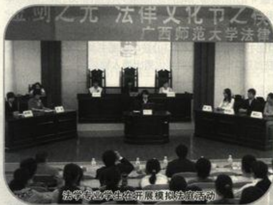
法学专业学生在开展模拟法庭活动

学、社会保障和法律、社会工作等七个硕士学位授予点。有法学、应用法学、社会学、社会工作四个本科专业,形成了研究生与本科生并存,全日制教育与成人教育并举的多层次办学结构。