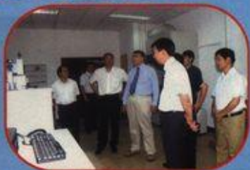
陈章良副主席(左三)参观我校重点实验室

6月4日,自治区副主席陈章良来我校视察指导工作。陈章良副主席听取梁宏校长的汇报后,参观了我校国际交流中心和药用资源化学与药物分子工程重点实验室。在药物分析实验室,他详细了解了药代动力学和高通量筛选、微流控芯片及毛细管电泳化学发光检测等实验装置在中草药活性化合物筛选和药代动力学临床检验方面的应用;在电喷雾质谱仪室,他了解了该仪器在中药成分研究及质量控制方面的应用,了解了金属基药物的研究近况和该仪器应用所获得的成果。他对我校国际交流工作取得的成绩表示肯定,对我校重点实验室的建设表示赞赏,希望我校能继续努力,争取更大成绩。(宣传部)