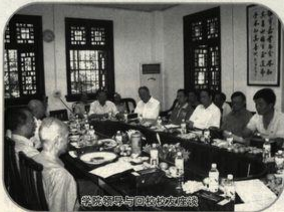
学院领导与回校校友座谈

学院科研力量坚实,成果丰硕。目前拥有广西人文社会科学重点研究基地即中国·东盟历史与现实研究中心、广西高校重点建设研究基地即广西文化产业研究基地以及校级研究机构广西师范大学地方民族史研究所、广西师范大学宗法与民俗文化研究所、广西师范大学旅游与文化产业研究中心、广西师范大学靖江王府博物馆等科研机构。学院具有省级旅游规划设计资质,可以独立承担旅游规划项目。近年来学院共承担省级