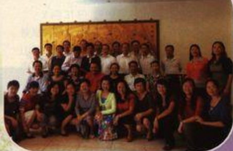
校友们与老师合影