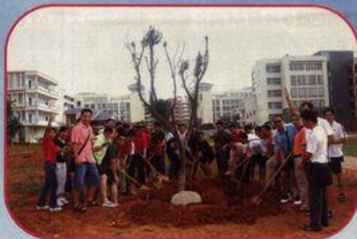
校友们希望爱心树苗茁壮成长

8月7日,我校原体育系95本70多位校友回母校聚会,纪念毕业10周年。在会上,校友总会负责人受梁宏校长的委托宣读了贺信,体育学院负责人介绍了学院的基本情况。参观雁山校区时,校友们为校友林捐种了爱心树。(陈国华)