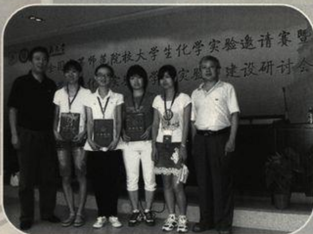
三位获奖学生(左二、三、四)领奖后留影