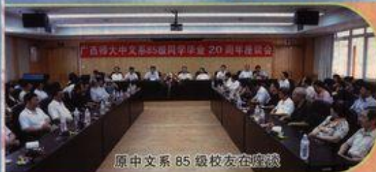
原中文系 85 级校友在座谈

8月8日,我校原中文系85级校友在育才校区聚会,纪念毕业20周年。到会的老师、同学有130多人。刘健斌副校长出席了聚会,对校友们的到来表示热烈欢迎,还简要地介绍了学校的建设发展情况。原校长张葆全及校办、校友总会、文学院等单位的有关领导也参加了聚会活动。校友总会负责人受梁宏校长的委托在会上宣读了贺信。