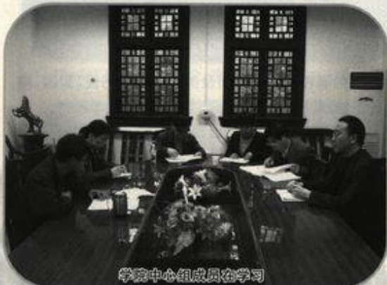
学院中心组成员在学习

经过七十多年的探索与发展,学院办学模式有了较大变化,下设历史学、旅游管理、文化产业管理3个系,拥有15个硕士学位授予点,由原来单一的师范教育模式调整为师范专